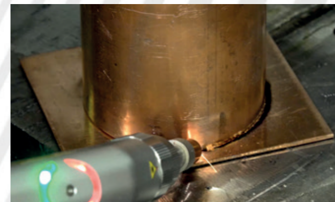
Прочная и герметичная сварка медной трубы толщиной 2 мм к медному фланцу толщиной 3 мм