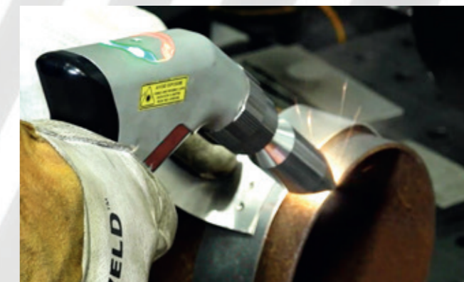
Высокопроизводительный режим очистки до и после сварки